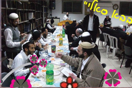
"פילאג פ"פכא סאלו"