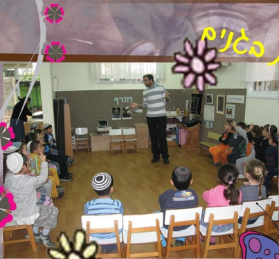
"פילאג פ"פכא סאלו"